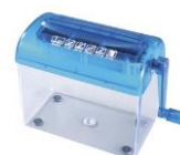
手回しシュレッダー