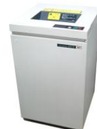
明光商会シュレッダー