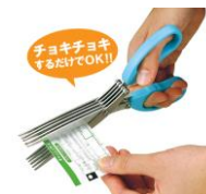
シュレッダーはさみ