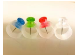
プニョプニョピン