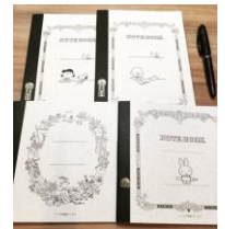
ツバメコラボノート